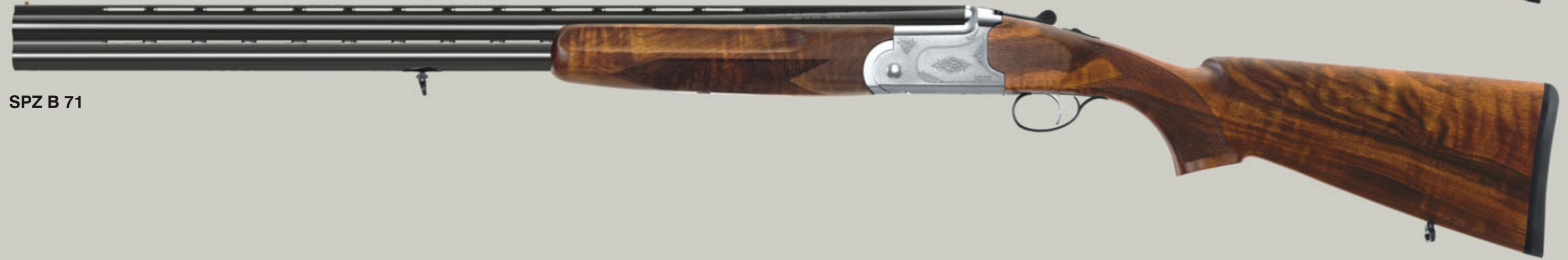
SPZ B 71