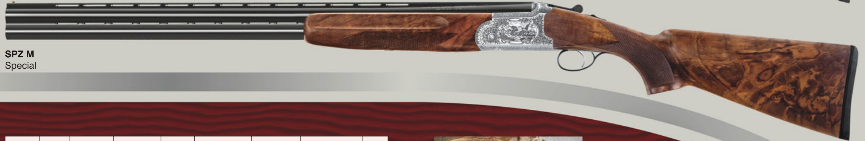
SPZ M Special