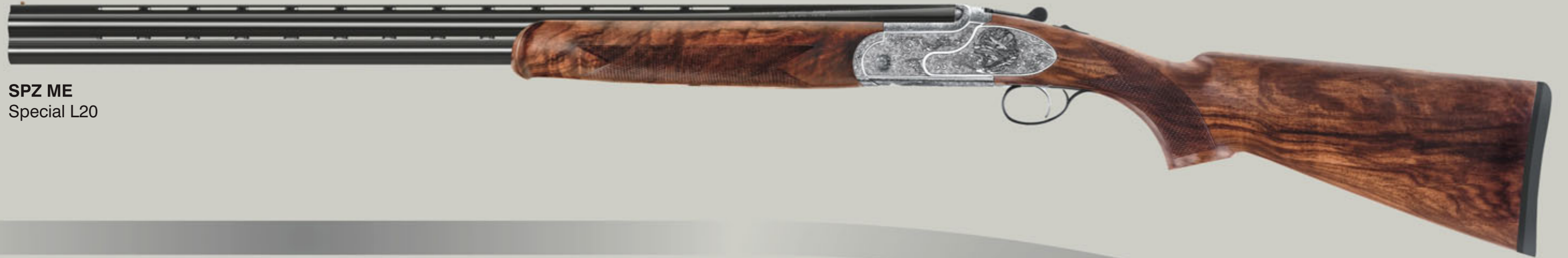
SPZ ME Special L20