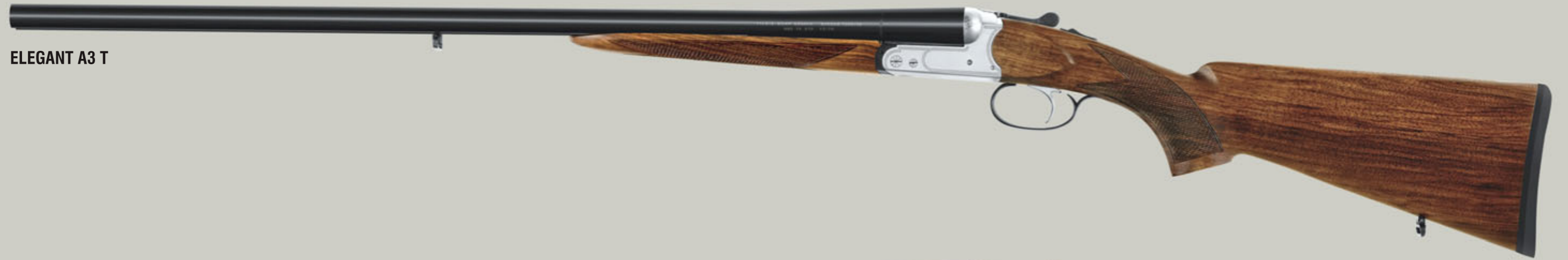
ELEGANT A3 T