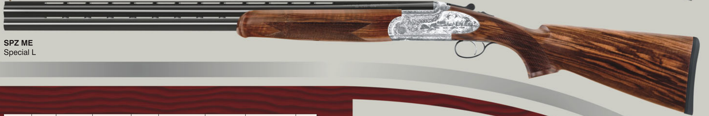
SPZ ME Special L