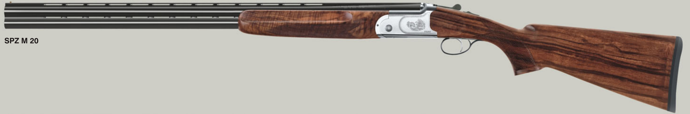
SPZ M 20