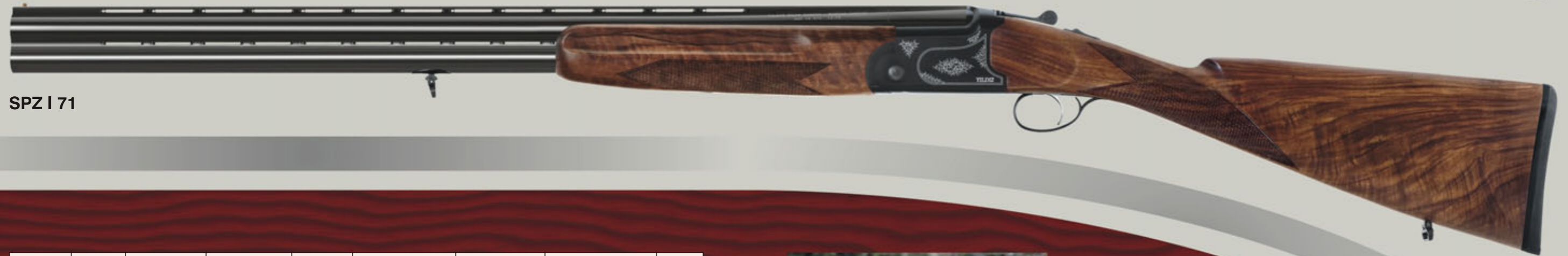
SPZ I 71