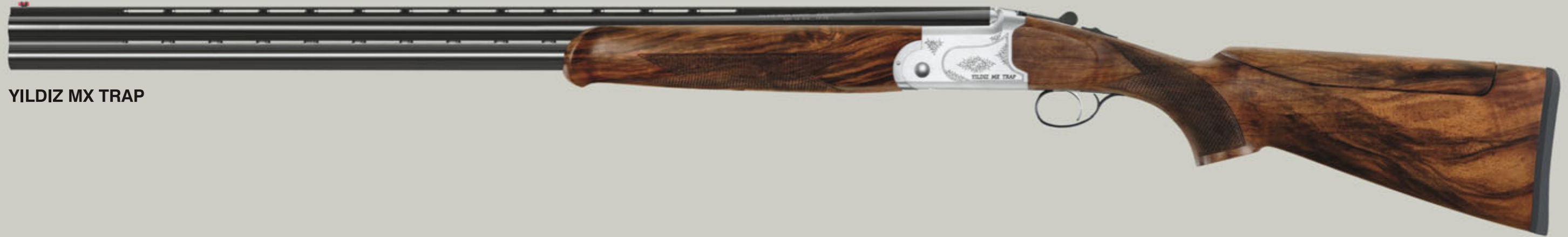
YILDIZ MX TRAP