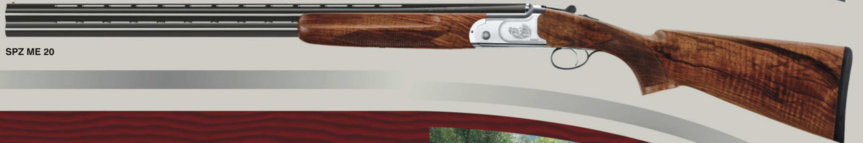
SPZ ME 20