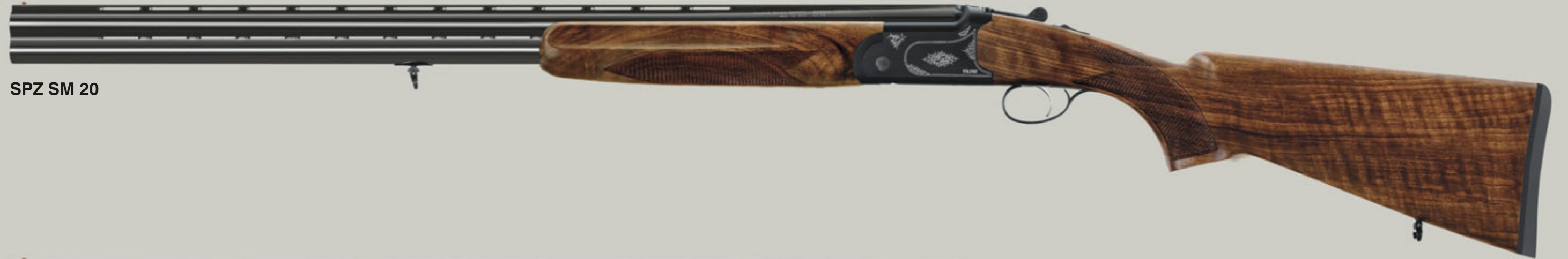
SPZ SM 20