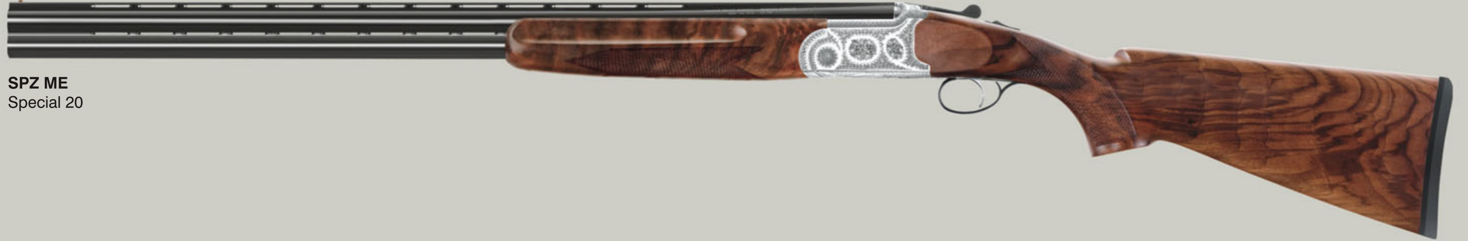
SPZ ME Special 20