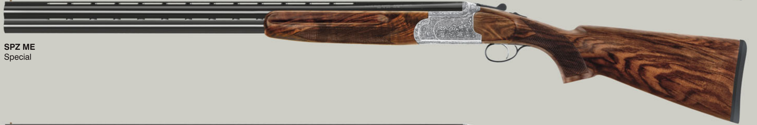
SPZ ME Special