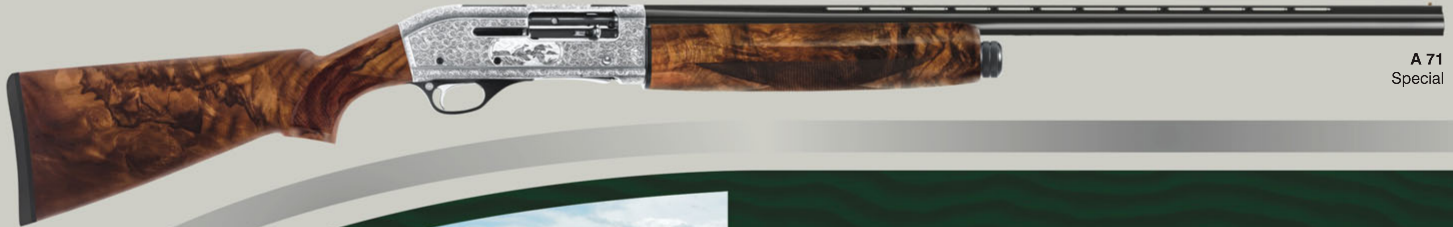
A 71 Special